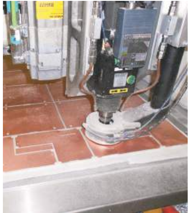
Circuits imprimés usinés sur place.