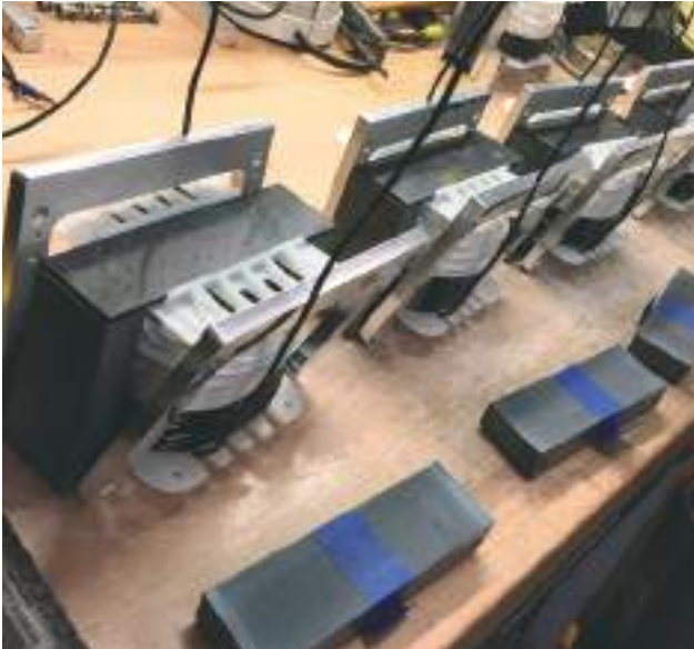
Inductances ViseCoil de filtre de grave : bobinées par machine numérique puis enserrées dans une structure fraisée pour éliminer les vibrations et resserrer les tolérances. La perte résiduelle est réduite de 24 % et la linéarité est améliorée de 60 % par rapport aux meilleures inductances du commerce.