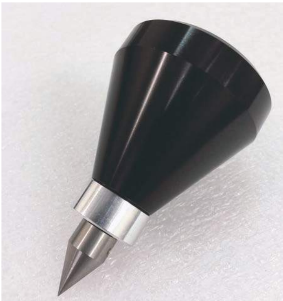
Pointe en aluminium et en acier inoxydable usinée in situ.