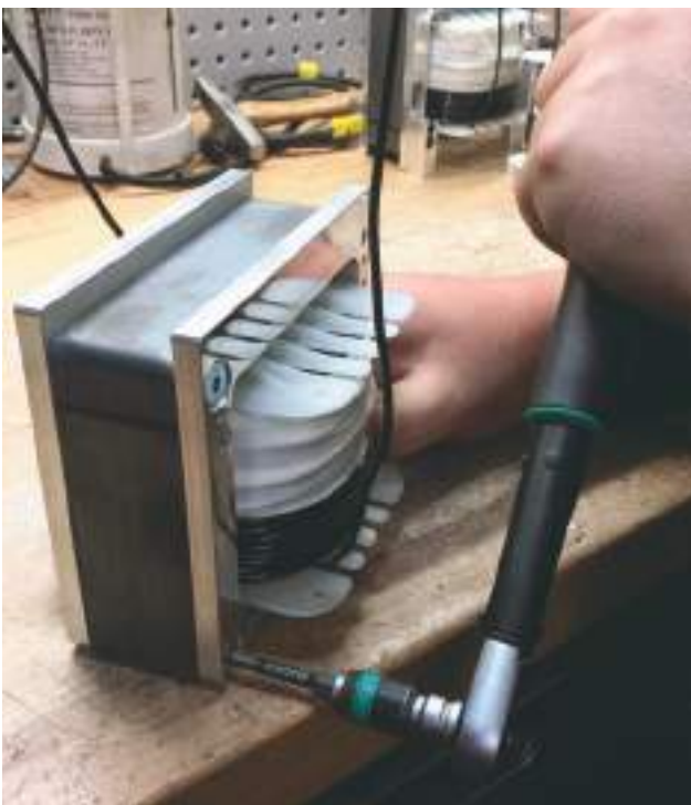
Assemblage final d'une inductance de grave ViseCoil.