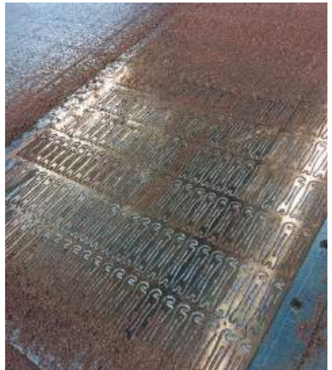
Straps pour sortie haut-parleur usinés en cuivre très pur.