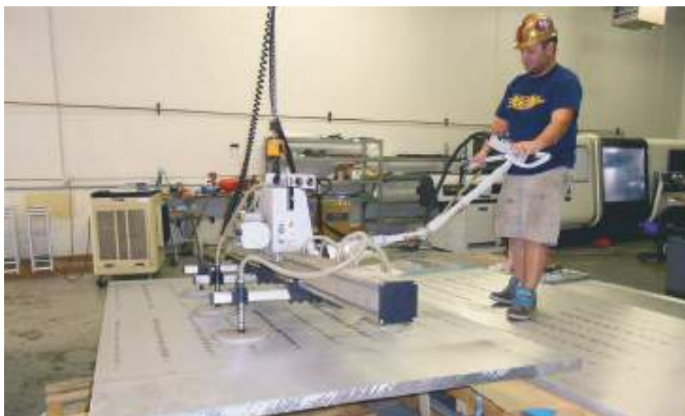
Le hall d'usinage. Le déplacement des grandes plaques (jusqu'à 700 kg pour une seule plaque) peut être effectué par un seul homme en utilisant cette grue à vide.

Devant le prix exorbitant de certains produits audio haut de gamme, l'audiophile se demande souvent s'il en a réellement pour son argent. Les enceintes acoustiques YG Acoustics rentrent dans cette catégorie de produits inabornables pour le commun des mélomanes. Ce petit reportage photos montre la façon dont sont fabriqués les modèles de la gamme Sonja. Nul doute qu'après l'avoir parcouru, tout le monde sera d'accord pour trouver une véritable justification dans la tarification de ces enceintes tout à fait hors du commun.