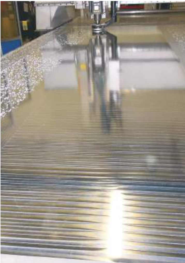
Usinage des parois des enceintes.