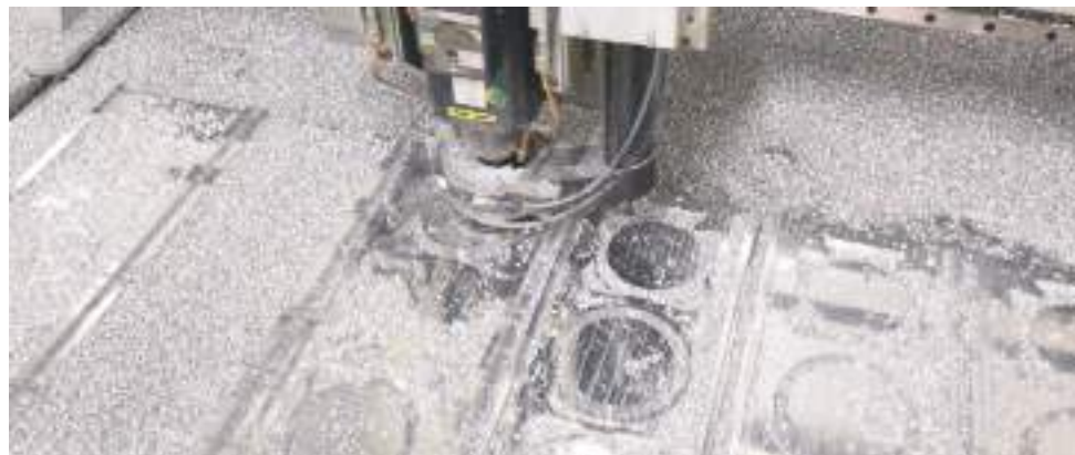
Fraisage d'une grande plaque sur la table de fraisage CNC Portatec grand format (1,52 x 3,04 m). Cette machine programmable à aspiration est la plus grande table de fraisage CNC de l'industrie audio high-end. Les faces avant sont en usinage sur cette photo.