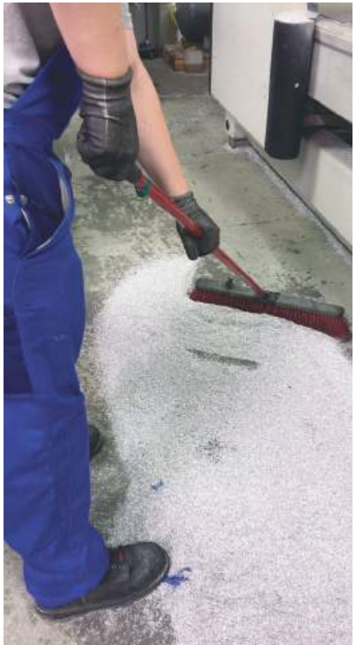
Les copeaux d'aluminium issus du processus d'usinage sont collectés et recyclés.