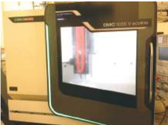
La fraiseuse CNC utilisée pour la finition cosmétique des parois des enceintes YG Acoustics.